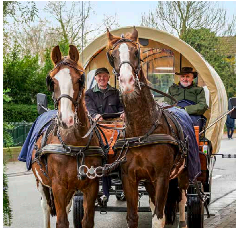
Advents-Highlights in Visselhövede im Pferdewagen erleben

die Stadtwerke bereit, um Fragen zu Energietarifen zu beantworten und über aktuelle Angebote zu informieren. In harmonischer Atmosphäre entwickelten sich viele wertvolle Gespräche mit Rotenburgerinnen und Rotenburgern. Besuchen Sie uns sehr gern wieder – auch in unserem Kundencenter!